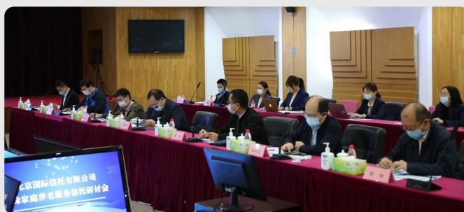
（北京信托组织召开“特殊家庭养老服务信托”研讨会）

案例2：2022年4月20日，北京信托召开“特殊家庭养老服务信托”研讨会，对特殊家庭养老服务信托实践中的掣肘与难点开展了深入交流研讨，为保障特殊家庭老年群体长远利益做好金融服务。市民政局、北京银保监局、审计署、中国信托业协会、北京康养集团、北京精诚公证处等领导、专家参加会议。