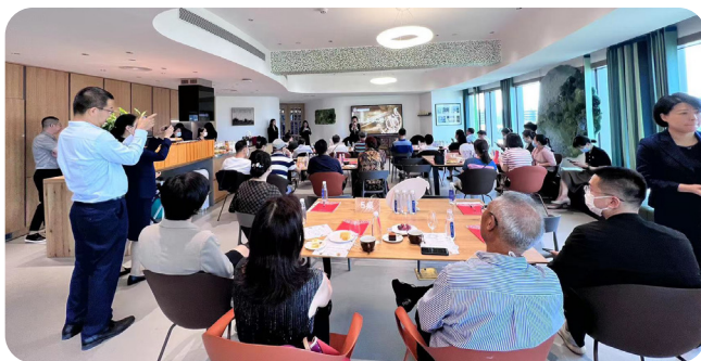
（“京品荟·与信行”权益客户高端品鉴活动）

提高高净值客户服务水平，全年累计开展特色活动 14 次，包含“2022 年 TOF 展望策略会”“拾月京享”等特色线上直播，总动员人数超 10 万人；深度展现公司投资研究实力，在疫情防控允许的条件下举办“京品荟·与信行”“走进北京信托”等线下活动。