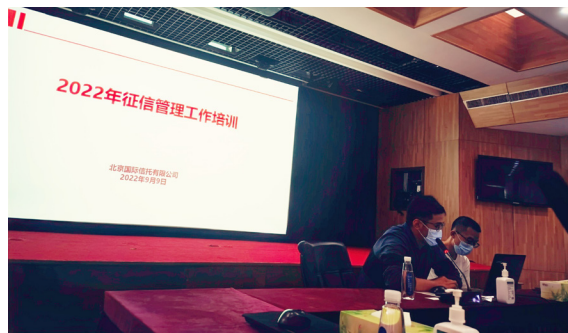
（2022 年征信管理工作培训）

紧扣公司转型发展，组织开展“相约星期五”培训，涵盖财富管理与家族信托、标品业务等主题 27 个，培训覆盖率达到 100%；结合疫情防控形势和员工个性化学习需求，引进信托业协会等相关机构举办的优质线上课程，有效补充公司各类学习资源。