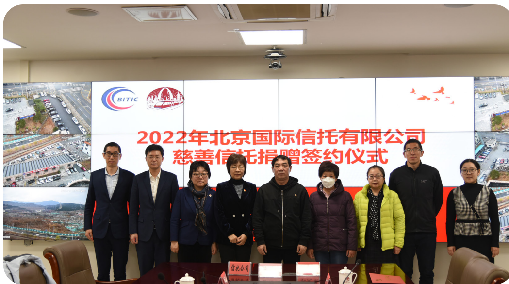
(北京信托联合永定镇政府举行慈善信托捐赠签约仪式)

慈善信托方面，主动投身公益慈善事业，不断丰富慈善信托助力共同富裕模式创新，持续开展公益服务，支持扶贫济困、促进科教文卫体等事业发展，截至 2022 年末，存续慈善信托 7 个，规模 1056.72 万元。