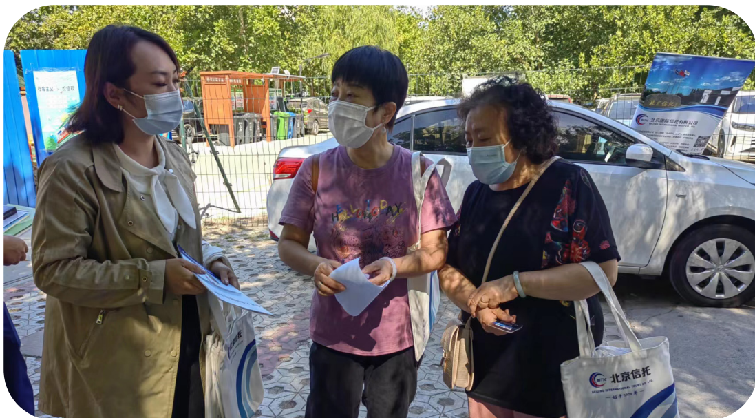
（北京信托“9月金融知识宣传月”活动）

组织开展“3·15”消保宣传周”“9月金融知识宣传月”及“防范非法集资宣传月”活动。活动覆盖群众近 10000 人次，发放宣传物料 1000 余份，官方渠道发布新闻 46 篇，构建全方位、多元立体化的消费者权益保护宣教体系。公司微信公众号开通“消保专区”子栏目，发布原创文章 20 篇。在 2021 年度消保工作监管评价中，北京信托获得北京银保监局辖内信托公司平均分第一名的好成绩。